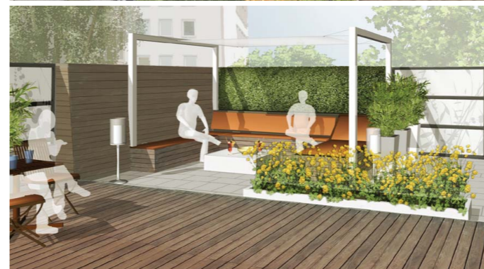
Die individuellen Terrassenbereiche der Maisonette-Wohnungen